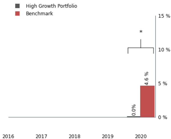
Klasse CI: staafdiagram met jaarlijks rendement

*: de prestaties in het verleden werden vergeleken met een oude samengestelde benchmark die niet meer van toepassing is.